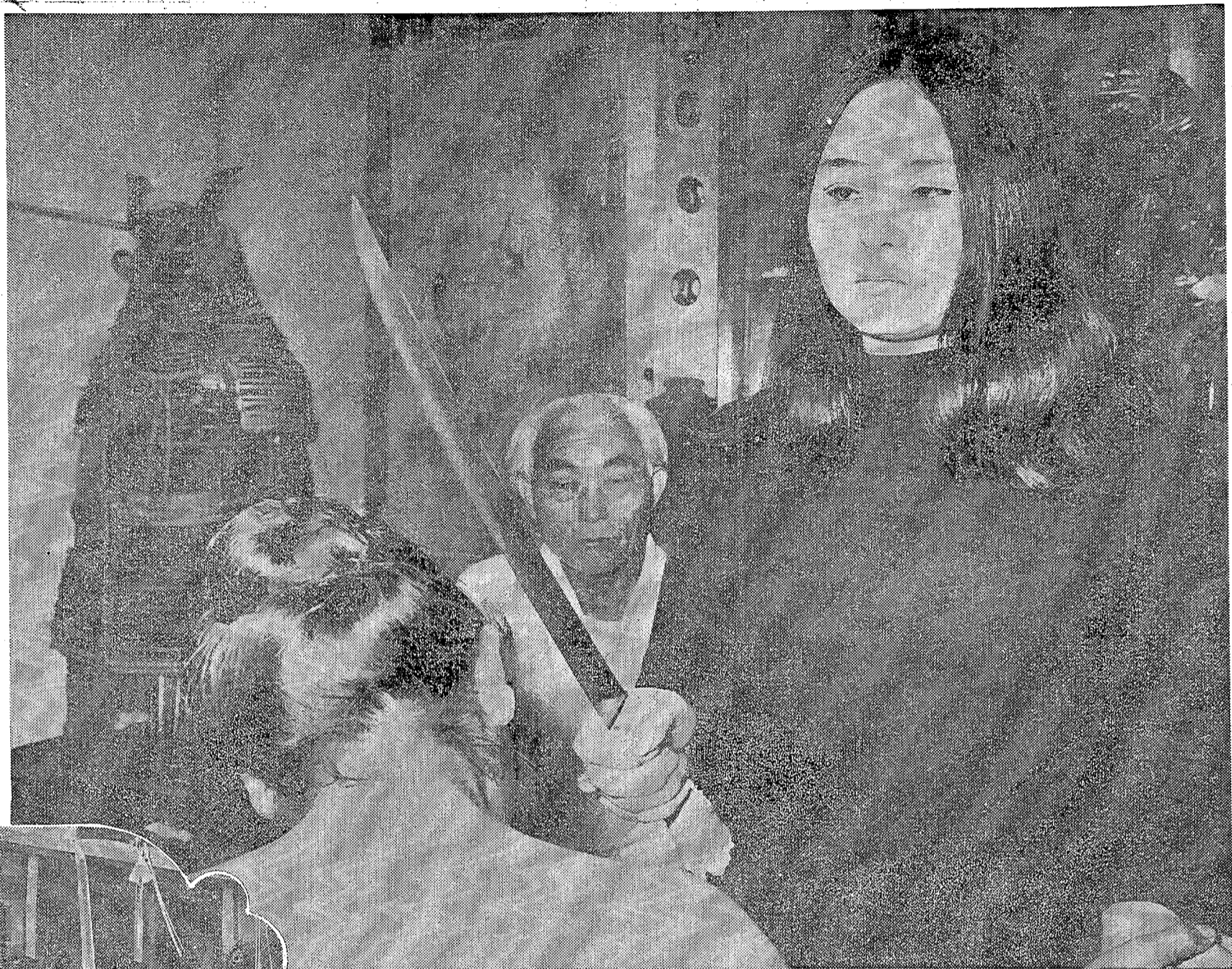
表情もきびしく無念無想の境地で、備前長船助光の小刀手に、四たれ、八たれの剣加持折鶴を、さう道子さん父の自然流準（室の相州正宗と称する三河の太刀）相対して心奪みかく