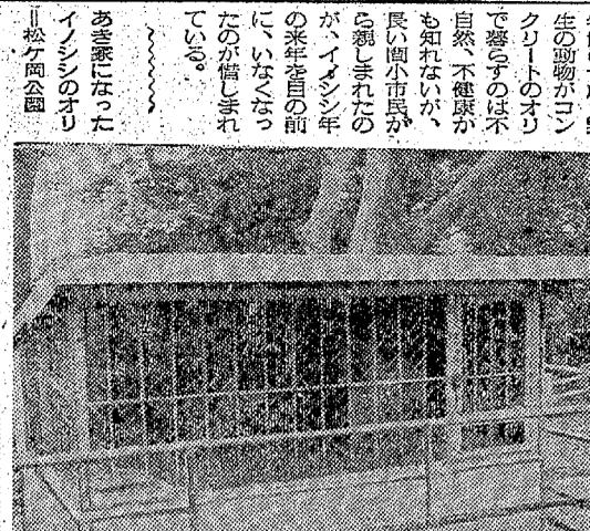
松ヶ岡公園の動物たち。その中でも、動物の維持管理に力を入れた。松ヶ岡公園の動物たち。その中でも、動物の維持管理に力を入れた。

松ヶ岡公園人気者の動物たち。その中には、松ヶ岡公園の動物たち。その中でも、動物の維持管理に力を入れた。松ヶ岡公園の動物たち。その中でも、動物の維持管理に力を入れた。松ヶ岡公園の動物たち。その中でも、動物の維持管理に力を入れた。