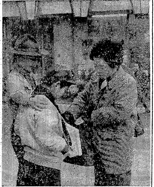
恵まれない人に 愛の手さと呼びかけるボーイスカウト。遠いパキスタンの被災者に贈られるが、通行者の関心は強かった