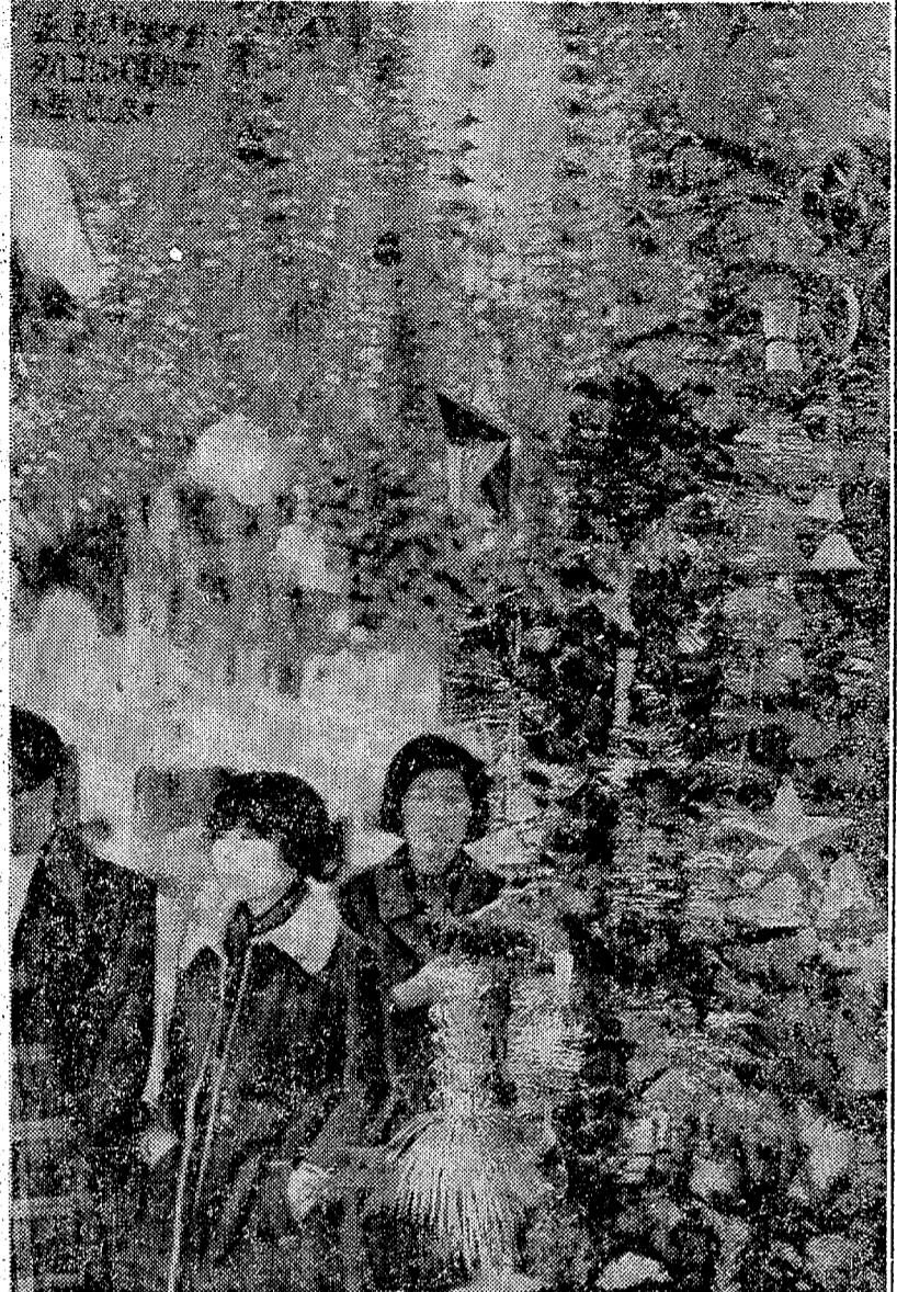
クリスマスツリーがジングルベルのメロディに乗って早くも飾られ、客足をとめる。飾り上げの本日は20日ごろからと見ている