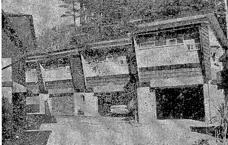
毎週水曜日夜11時25分福島テレビで宣伝中