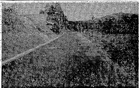
県が川前、滝根間で着手 山間地も簡易舗装 県が川前、滝根間で着手