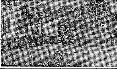
県が川前、滝根間で着手 山間地も簡易舗装 県が川前、滝根間で着手