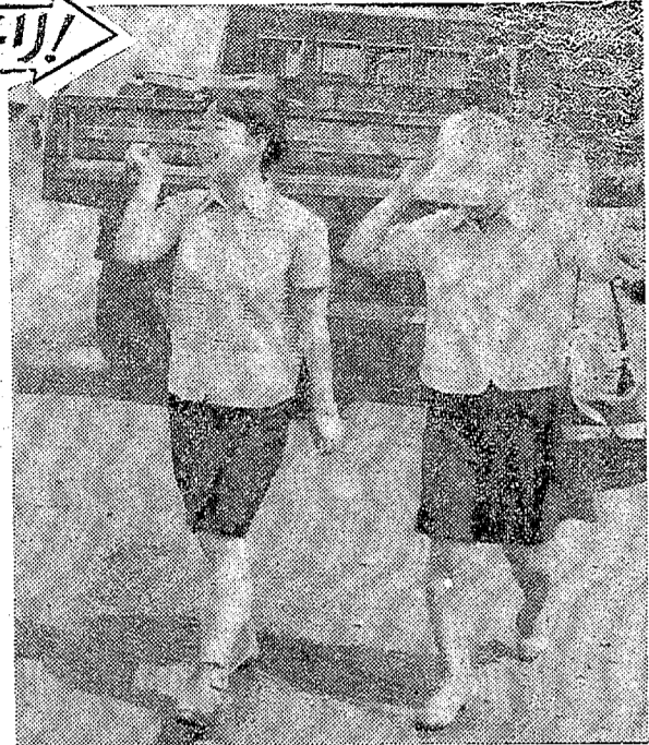
「暑いから帽子をかぶるワ」—平・中町で—