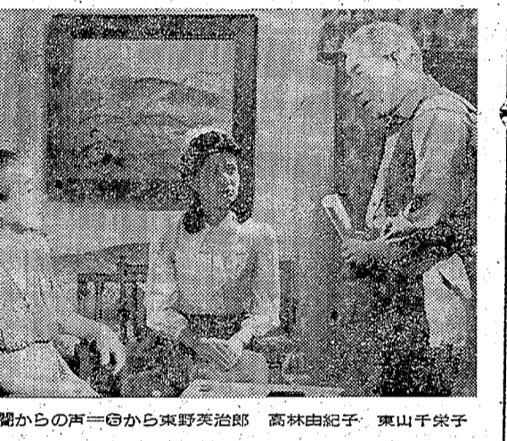
聞からの声 舟木一夫から東野栄治郎 高林由紀子 東山千栄子