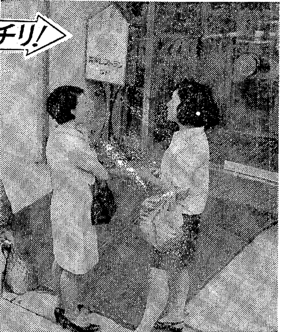
この写真おげます