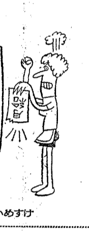
マンガ・邦かめすけ

『二十万都市という人口に期待して...』 埼玉の海を渡る。サカナも新鮮... 悪いことだらけ