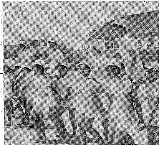
【小の大運動会】騎馬戦... 十四年度優良船主並びに漁業長を表彰した...

いわき農地事務所が「月収現在...」と、開拓農家の収入状況について詳しく報告している。特に、出稼ぎに依存する農家の増加が注目を集めている。