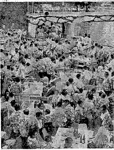
常磐炭礦の新年あひさつ

常磐炭礦とその系列十社共同による、恒例の新年あひさつ、市民とともに80年。常磐炭礦とその系列十社共同による、恒例の新年あひさつ、市民とともに80年。常磐炭礦とその系列十社共同による、恒例の新年あひさつ、市民とともに80年。