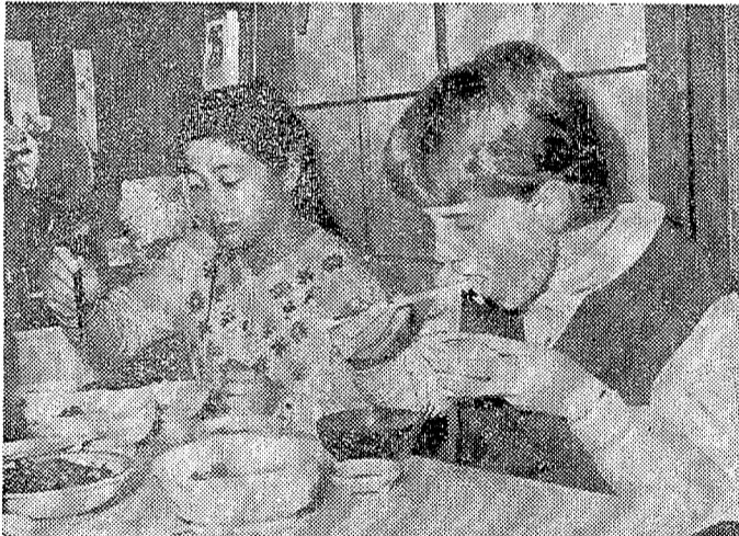
生活に食事にたもうと努力しているかと思われ、らい金細いのはなんでもおかしそうにいた