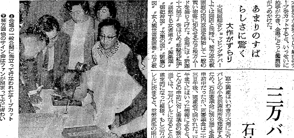
会場の一般公開に先立ち行なわれたテープカット