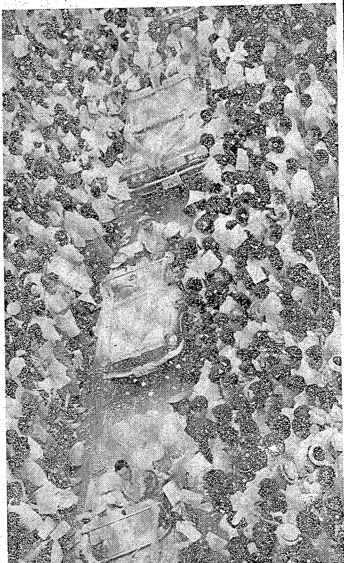
人波わけて進む歓迎パレード (平・二丁目)