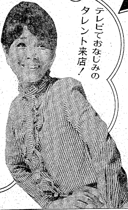
テレビでおなじみの タレント来店!