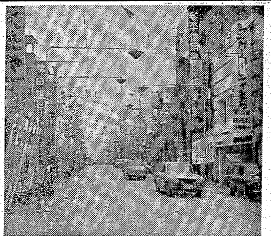
七夕に続き、納涼道路が平の西部商店街で実施された。

七夕に続き、納涼道路が平の西部商店街で実施された。道路はきれいに清掃され、涼やかな雰囲気が漂っている。市民の憩いの場となっている。