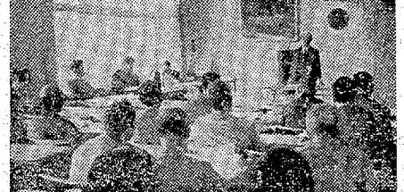
【平衛生組織連の役員会】

いわき市平地区衛生組織連合会が、好間地区の加入を強化している。好間地区の加入は、市民の健康と安全を守るためである。 また、好間地区の衛生を確保するためである。好間地区の加入は、市民の健康と安全を守るためである。