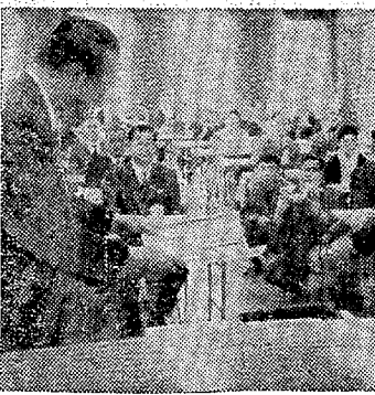
保安技術の表彰も... 保安技術の表彰も...