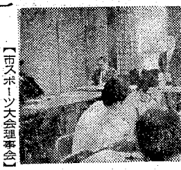
【市スポーツ大会実行委員会】

いわき市体育協会の主催で、二十三日午後三時から同市平、産業会館で開き、第四回いわき市スポーツ大会が開かれた。 大会は、いわき市市民スポーツ大会として開かれた。いわき市市民スポーツ大会は、いわき市市民スポーツ協会の主催で、二十三日午後三時から同市平、産業会館で開かれた。大会は、いわき市市民スポーツ大会として開かれた。