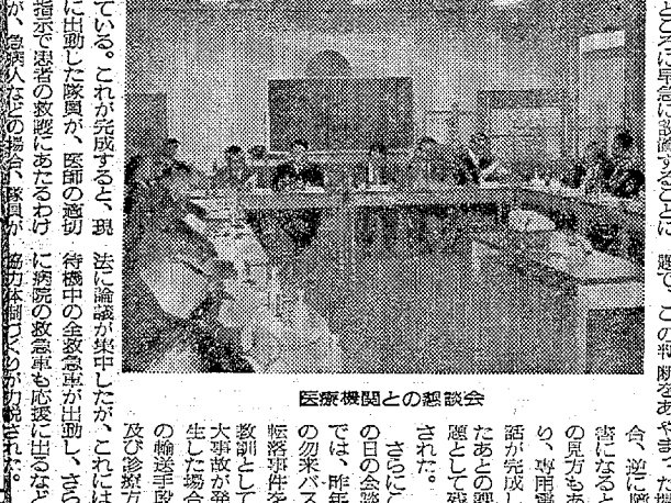
医療機関との連携を強化し、救急業務の効率化を図る。ジャンボ救急車の導入により、救急業務の効率化と患者の安全確保が期待されている。

東北予選の演奏発表が、観客を魅了した。演奏は、音楽の力で観客の心を揺るがせ、大きな反響を呼んだ。関係者は、今後の大会でもこのような素晴らしい演奏を発表することを期待している。 演奏は、音楽の力で観客の心を揺るがせ、大きな反響を呼んだ。関係者は、今後の大会でもこのような素晴らしい演奏を発表することを期待している。