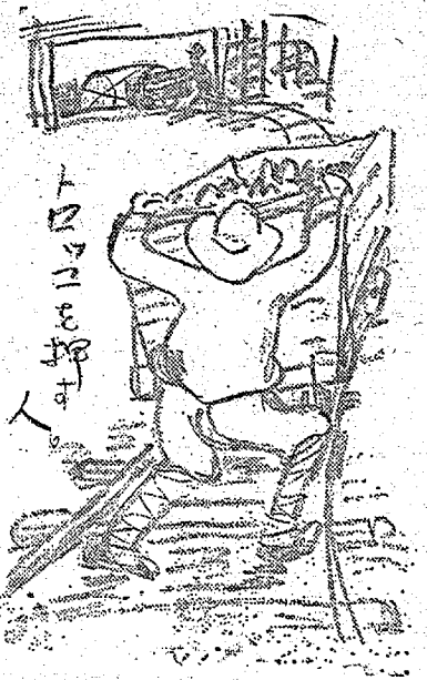
猪狩満直のスケッチから トロッコを押す人