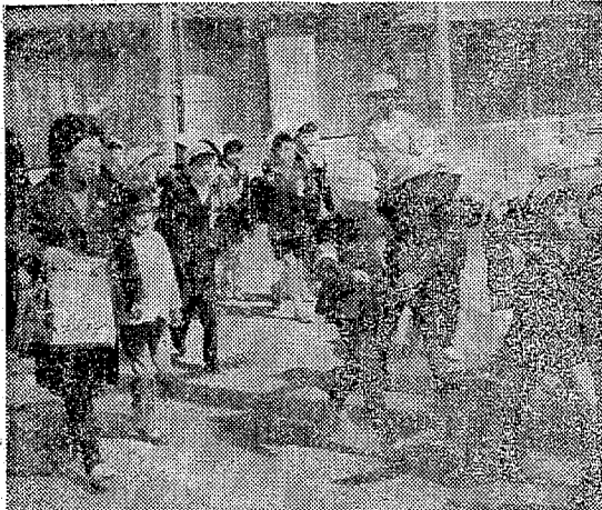
交通安全運動の進行中。関係者の努力が実る。