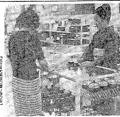
【三百大議員の話し合い】

この日は、三百大議員の話し合いが行われ、新政会の結成が決定された。議員たちは、今後の市政運営について話し合い、一致を築いた。