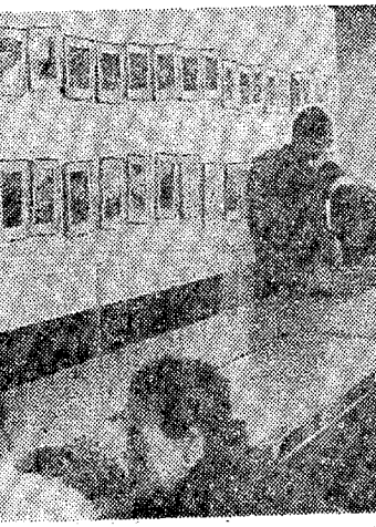
薬草展示会と薬相談に人気

薬草展示会と薬相談に人気。展示会では、様々な薬草が展示され、薬師による相談も行われた。