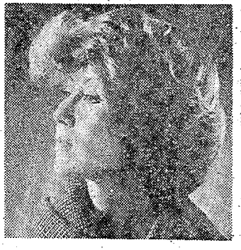
【バックからサイドにかけてメリスマカにしては型取り型】

秋のニューヘアモードは、本格的なスタイルを追求する。毛の流れ、シルエット、質感、すべてが、この秋のヘアモードのキーワードである。メリスマカ、サイド、バックからサイドにかけては、型取り型が流行している。これは、メリスマカ、サイド、バックからサイドにかけては、型取り型が流行している。これは、メリスマカ、サイド、バックからサイドにかけては、型取り型が流行している。