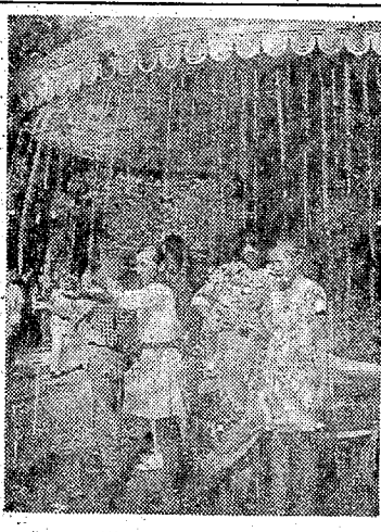
ソ連邦の青少年代表の一行が、いわき市を訪れた。

ピオネールでの生活は、少年たちにとって、人生の貴重な経験の一つである。自分たちの生活と、ソ連邦の生活とを比較対照し、互いに学びあう。これは、青少年の成長にとって、最も大切なことである。 ソ連邦の青少年は、朝早く起床し、学校や労働現場に向かう。彼らは、勤勉で、誠実で、勇敢な精神を持っている。彼らは、自分たちの生活と、ソ連邦の生活とを比較対照し、互いに学びあう。これは、青少年の成長にとって、最も大切なことである。