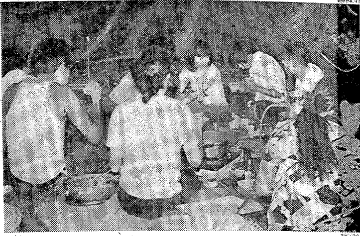
山頂で民踊など楽しむ