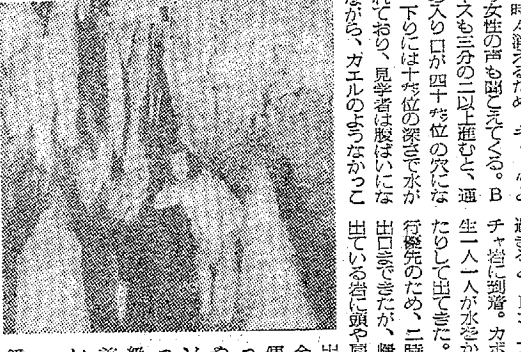
鍾乳洞探勝の風景。...