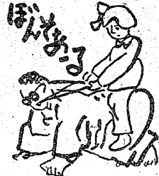
君笑うことなかれ