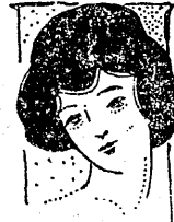
夏の家庭衛生(其二) 夏は病氣には胃腸の疾患が大關である、殊に過食もあるが、恐ろしい菌や又ハ蠅といふ嫌な虫の足に付いてゐるばい菌その他不潔

鯛デンプ 頗る好評 警城七濱みやげとして近來素晴とい勢で賣れ出し初め各方面から美味と經濟を以つて歡迎されて居る三丁目角阿部源の鯛デンプはメートル法展覽會にも出品し計物のために胃腸を害するこどが大變に多い、これ等を豫防するには食物の注意や、健康も大切ではあるが、先づ何よりもお台所を司る主婦の注意が行き届いて欲しい、二三の主要事項を擧げれば「流し端」は太陽の光りに當たるやうにしたい尤も家の構造からして考い