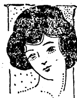
家庭欄 子供服を作る時の注意

十日松ヶ岡公園の忠魂祭には午前九時から安藤閣老の銅像前を會場として大日本武德會福島支部石城分會主催に依る優勝旗爭奪の演武大會がある。練爛の花下に龍虎相搏つのは壯觀これは例年の實例に徴して殆ど既定の事實である