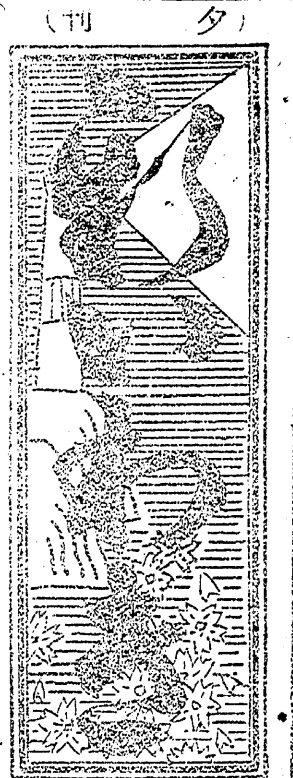
夕刊 第一二五號 郵部長は府縣知事に、府縣知事は府縣會議員に、府縣令からは召集徴發一刻を争ふ示講許に於て非常の謙辭を入替までの實演は各町村共受けた。