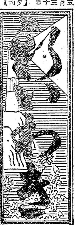
日曜大衆 日一十月三年五和昭 日一十月三年五和昭