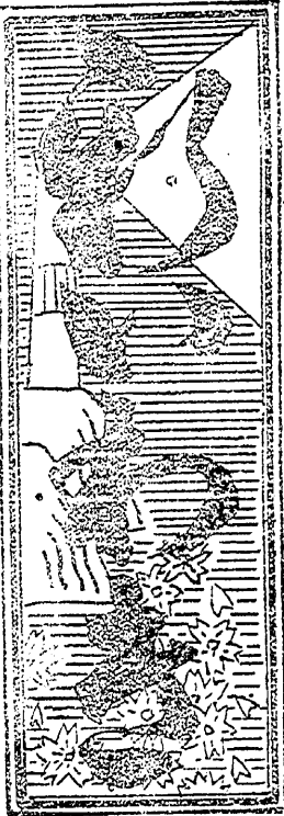
平町大祭の日 五月廿五日 夕刊 第一頁 第二頁 第三頁 第四頁 第五頁 第六頁 第七頁 第八頁 第九頁 第十頁 第十一頁 第十二頁 第十三頁 第十四頁 第十五頁 第十六頁 第十七頁 第十八頁 第十九頁 第二十頁 第二十一頁 第二十二頁 第二十三頁 第二十四頁 第二十五頁 第二十六頁 第二十七頁 第二十八頁 第二十九頁 第三十頁 第三十一頁 第三十二頁 第三十三頁 第三十四頁 第三十五頁 第三十六頁 第三十七頁 第三十八頁 第三十九頁 第四十頁 第四十一頁 第四十二頁 第四十三頁 第四十四頁 第四十五頁 第四十六頁 第四十七頁 第四十八頁 第四十九頁 第五十頁