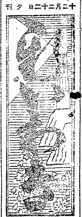
第二師團長官邸下 將校の演習御巡察 今日午前七時御旅館御出發 植田町に向はせられて