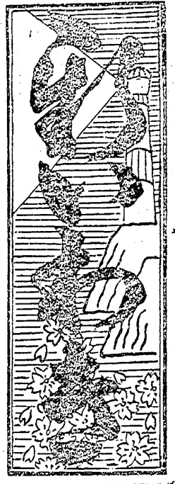
常識講座 革命主義のことで我が國では労働赤色組合の事を指す、運動直接行動をとり資本家社会を倒さんとするもので其最後にして最大の武器は総同盟罷業である