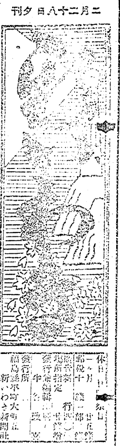
小名濱海岸の 舟死體 乙食食下者上野町 二十七日朝小名濱海岸、漁業組合事務所の署前に今年七十歳位の食風の漁死体が着着してゐるのを発見、小名濱駐在所で検屍の結果は橋本縣警署に送附された。送附された時、橋本縣警署の署前に着いた。署前に着いた時、署長は「舟死體」として、署前に着いた。署前に着いた時、署長は「舟死體」として、署前に着いた。