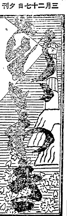
休日 日曜 日 郵税十五錢 行四〇錢 廣告料 一行四〇錢 發行所 平野印刷 牛谷 政 新開社