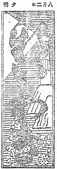
本日 日曜 第九百二十五號 郵政省 第五十五號 第一二五號 發行所 石城郡平町大町二丁目 電話 二二二二 牛谷政彦 新いわき新聞社

スクールは誰が云ふ 学校のことは、スクール デイは學生時代または 學校時代の意、スクー ル、ボーイは學童又は 學徒、スクール、ボー イは學校仲間とか同窓 とか學友のことである