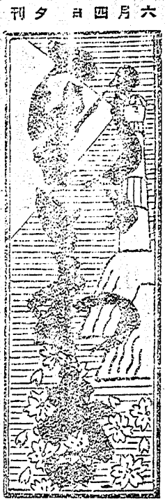
刊夕日四月六 一日日曜 郵税十五錢 二五錢 寄附金 行四十四錢 發行所 中谷政客 新島縣平町大町二三 新いわき新聞社