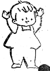
わたしの名前 三男の三郎 三和村収入役 田子三郎