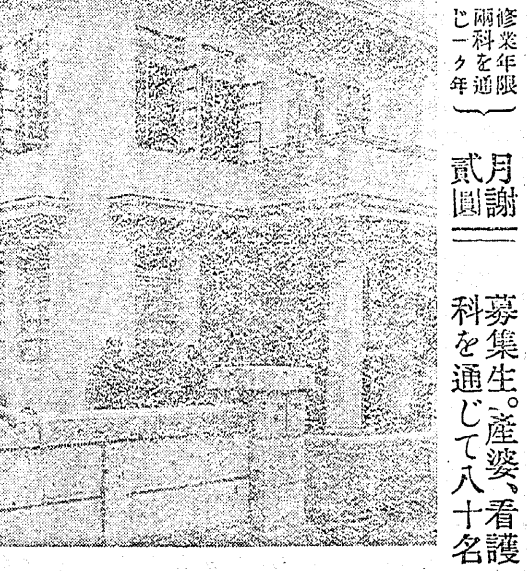
新築校舎には、産科の實習に「産室」を設備致し寄宿生の爲めには完全な自炊便を備えてあります