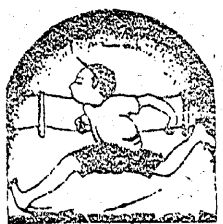
各學校秋季運動會

平野町小學校の秋季運動 會は來る十月八日同校庭に於 て開催されると 湯本町の入山小學校では 來る十月四日午前八時から同 校庭に於て運動會を催すと