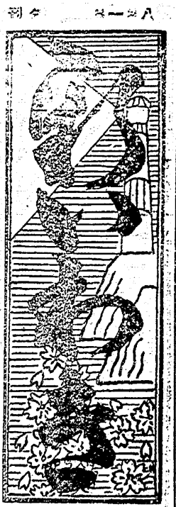
日刊新聞 昭和十三年七月五日 発行所 東京市本町三丁目三番地 電話 二二二二