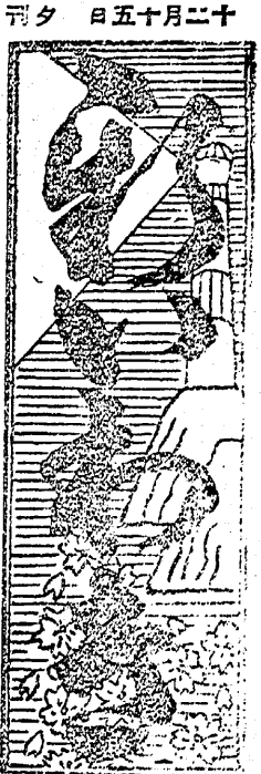
五月十日二十 刊夕