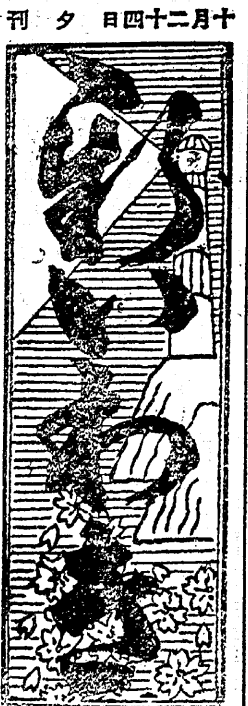
日刊 昭和三十五年三月三十一日 第三十三號 新報 支那語