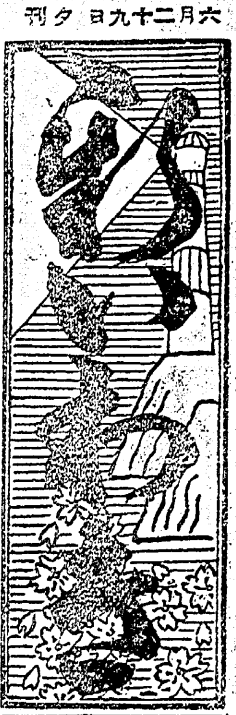
日刊 日九十二月六 刊夕 日九十二月六

支那軍語 手袋を手袋と書いてシオウタール、腕時計のことは手表と稱してシオウピヤオ、眼鏡はイエンタン、財布のことはチエンタリエルと呼び、扇を扇子と云ふ文字でシヤンツと呼ぶ。