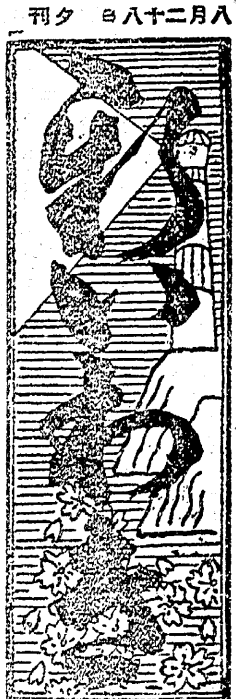
鮫川疏水の竣工式