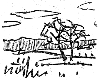
近代文学の女性たち