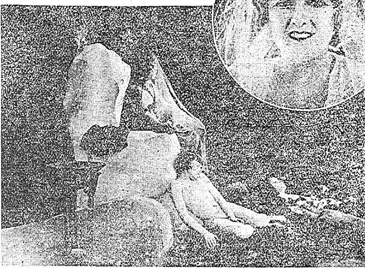
赤穂浪士 一巻 船橋 宮崎 最勝 氏 特別 解説