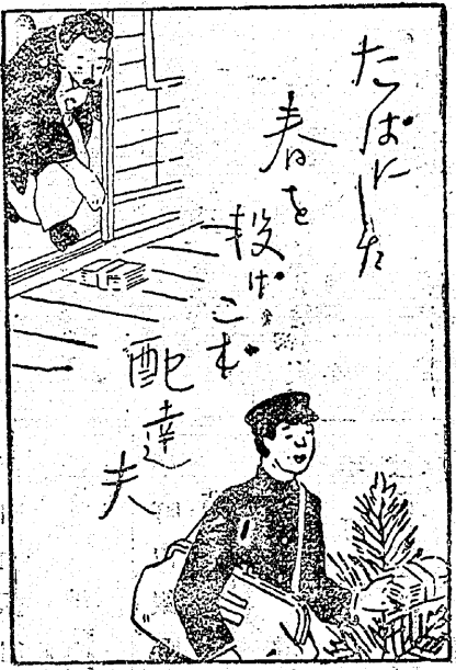
因に年賀状 の廿日 廿八日まで の取扱ひ別 左の如くで ある

去る廿日以來ラッシュする年賀した豫想である、この年賀状の 状に平郵便局は佐藤局長以下不慮が過ぎると今度は衆議院選挙 眠不休の涙ぐましい活動を続けなほ時代の尖端を行くものとい たが、一体どのくらい年の賀状はれる年賀電報は廿五日より引 を取扱ったといふと廿八日まで受けを開始したが廿日現在で發 の合計は引受廿一萬九千八百卅九通、着信六十通、中繼 三通中繼五十七萬七千七百六十七七十八通合計百九十七通でこ れ、配達十三萬六千三百九十九通はさすがに押詰つた廿一日ごろ で總計實に八十六萬三千九百九十から急に殖え出すものと見られ 九通といふ途方もない数字を示してゐる、