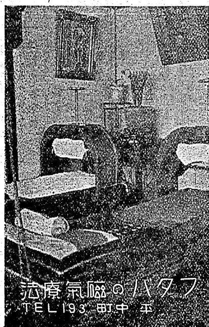
浴室氣暖のハタフ TEL 193 町中平