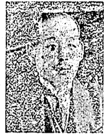
磐城民政の大御所