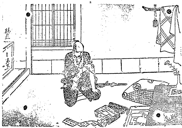
嘉助は戸口で、感しき