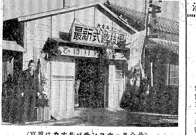
(写真はカオルパチンコホール全景)